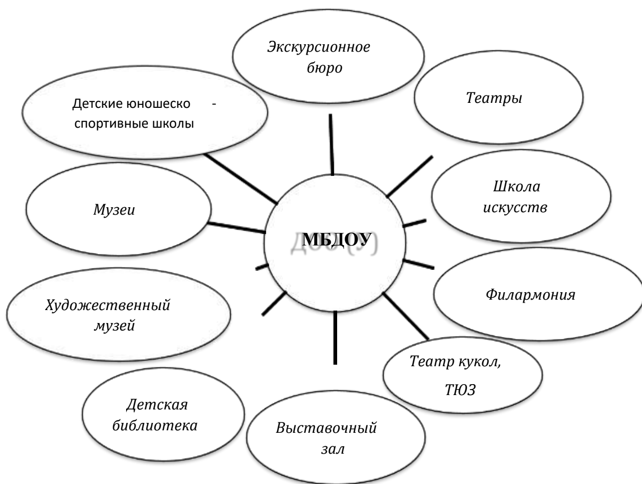
Рис. Возможные партнеры при реализации регионального компонента программы

Таким образом, получается, что социальное партнерство — взаимовыгодное взаимодействие различных секторов общества, направленное на решение социальных проблем, обеспечение устойчивого развития социальных отношений и повышение качества жизни, осуществляемое в рамках действующего законодательства.